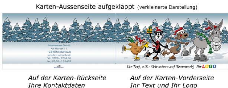
Auf der Karten-Rückseite Ihre Kontaktdaten